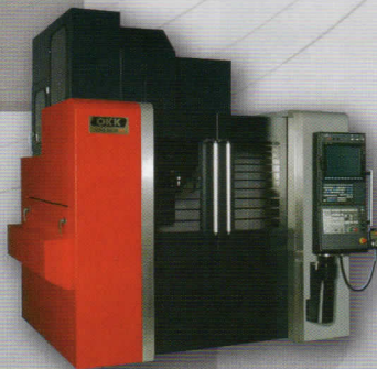
立型マシニングセンター VM53R