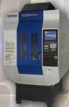
5軸マシニングセンター MX140X1