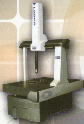
3次元測定器 CROMA 8106