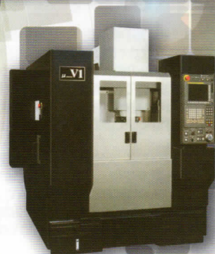
超精密立型 マシニングセンター μ-V1