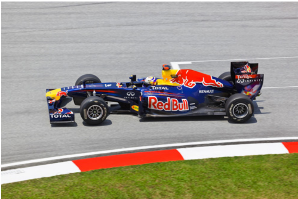
ペリカットは、Freeform Technology におけるモータースポーツ分野向けの複雑な金型やコンポジット形状の製作を支えている

Freeform Technology はフォーミュラ・ワンやモータースポーツ分野のサプライヤーだが、レースチームの間で基本的な要素において、人もうらやむ仕事の評判を急速に確立した。その要素とは正確さや情熱もそうだが、顧客との約束を確実に果たすため、より一層の努力をする、というこだわりだ。これらのゴールを達成するため、同社は世界で最先端の独立系の CNC 工作機械シミュレーションと最適化のソフトウェア、CGTech のペリカットを使っている。